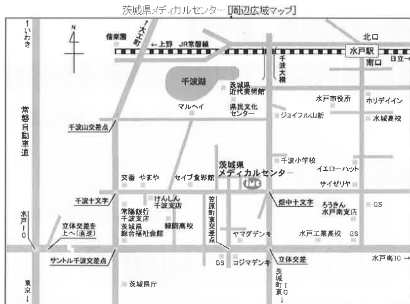
茨城県メディカルセンター [周辺詳細マップ]